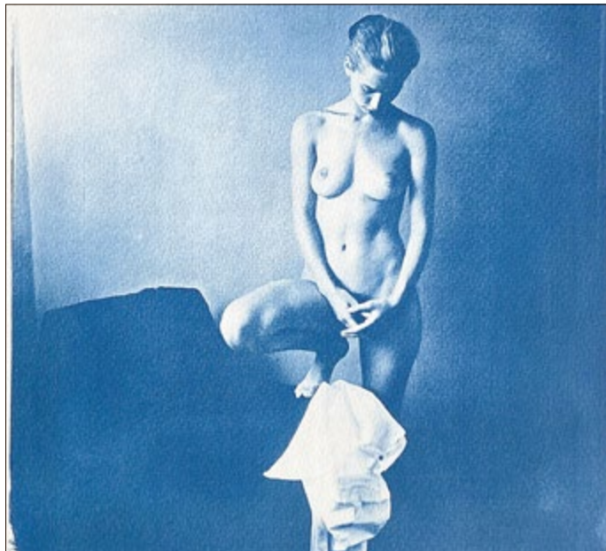
Analoge Aktfotografie von Uwe Steinbrück

Im GutsMuths-Sportsaal erwartet Sie eine weitere große Sonderausstellung: