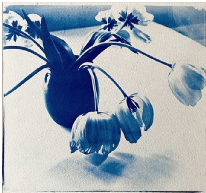
Analoge Blumenfotografie von Uwe Steinbrück