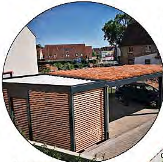
Carport mit angrenzendem Anbau (Schuppen)

EINE MARKE DER UNTERNEHMENSGRUPPE NASSAUISCHE HEIMSTÄTTE | WOHNSTADT