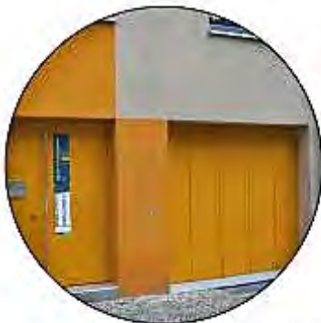
Fassadengliederung mit Garage im EG

Dachgestaltung: - Satteldach - Staffelgeschoss