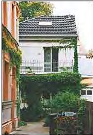
Wohnen im Hinterhof

EINE MARKE DER UNTERNEHMENSGRUPPE NASSAUISCHE HEIMSTÄTTE | WOHNSTADT