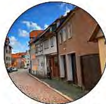
Straßenbild der Brühlgasse