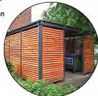
Einhausung als Abstell- Möglichkeiten z.B. - Mülltonnen - Fahrräder