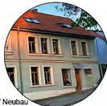
Bebauung / Neubau an Baustil angepasst