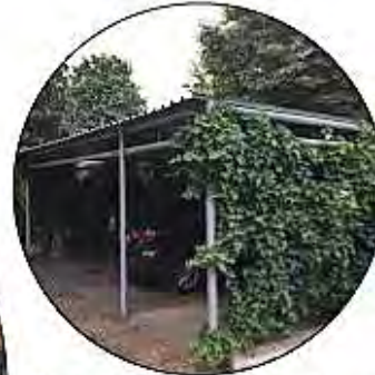
Carport mit Begrünungen - Fassaden - Dach