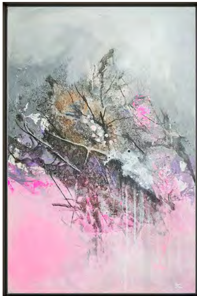
Kraft der Gedanken