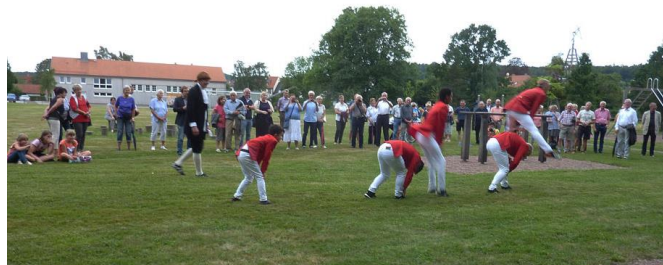
Feier zu GutsMuths' 260. Geburtstag am 9. 8. 2019 – GutsMuths und seine Zöglinge am GutsMuths-Sportplatz

April – Oktober Mi. - So., 10 - 17 Uhr November – März Mi. - So., 10 - 16 Uhr Januar geschlossen Tel. 03622/69170