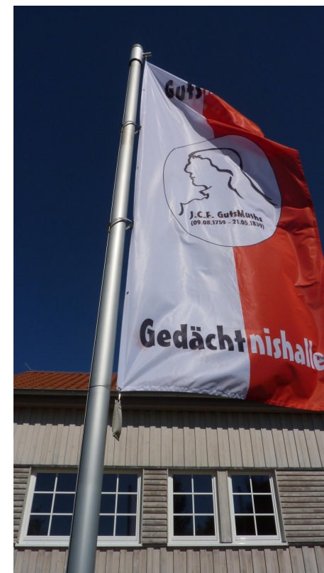
GutsMuths-Fahne vor der GutsMuths-Gedächtnishalle

Im Eingangsbereich vom GutsMuths-Museum bekommt man Informationen zu GutsMuths' Person und zum GutsMuths-Rennsteiglauf. Die offene Tür führt zum Sportsaal mit Ausstellungen.