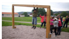
GutsMuths-Geräte auf dem Sportplatz