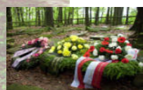
Waldfriedhof mit GutsMuths' Grab