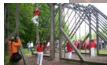
Erster Deutscher Gymnastikplatz